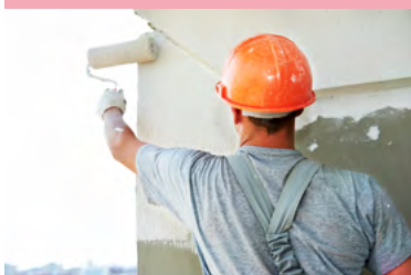
Base de impresión SP200