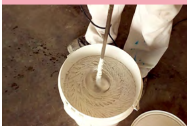
Mezclado Maplexine® Crepi