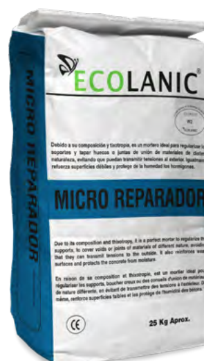
Agma CH y Microreparador